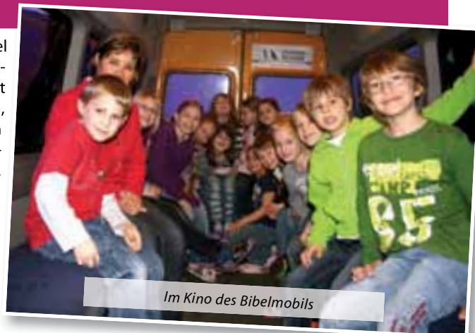
Im Kino des Bibelmobils

Wer dann noch die Millonenschau zum Thema auf dem Computer knacken kann, der hat sich eine kleine Bibel verdient. Auch im Kino gibt es einiges zu sehen: eine brennende Bibel, aber auch aus dem Leben Jesu, wie er lebte und was er tat. Die Kinder sind beeindruckt davon, auf welche Art Jesus den Menschen half. In der Bibel ist darüber jedoch noch viel mehr zu erfahren. Bewegt und sichtlich angetan ma-