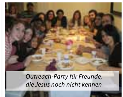
Outreach-Party für Freunde, die Jesus noch nicht kennen