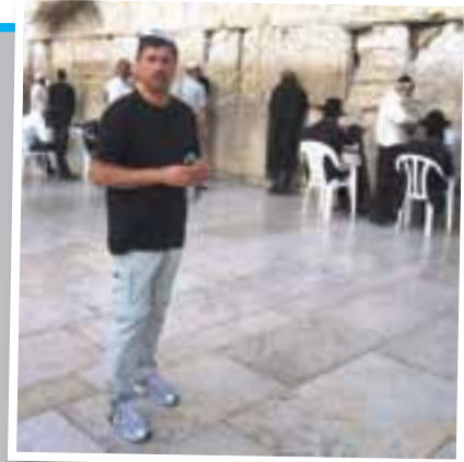
An der Klagemauer: Die Kippa zu tragen ist hier Pflicht.

„Es ist beeindruckend, wenn Dinge, die bislang nur in abstrakter Form und bestenfalls aus den Nachrichten bekannt waren, plötzlich ‚Gestalt‘ annehmen. Wenn die Reiseteilnehmer aus dem Mund der Christen in Israel hören, welche Last auf jedem einzelnen liegt, der täglich mit allen erdenklichen Schwierigkeiten umzugehen hat. Damit sind nicht nur die doppelt hohen Lebenshaltungskosten bei kaum der Hälfte des Verdienstes wie in unserem Land gemeint, sondern vor allem auch der vielschichtige Konflikt, der auf allen Ebenen spürbar wird: Religiös, wirtschaftlich, politisch, soziologisch.